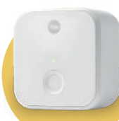
橋接器-遠端設備 (選配)